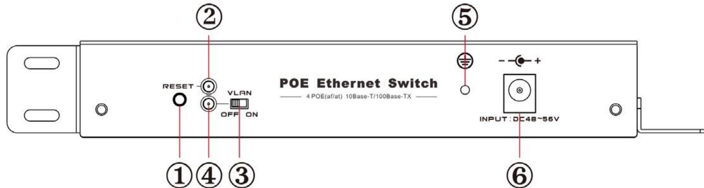
Vista del Panel Posterior