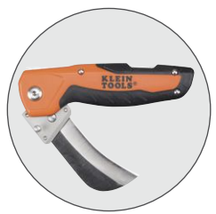
Imagen de cuchilla plegada en el mango