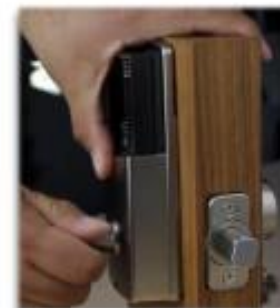
Verificamos funcionamiento mecánico. Sujetamos mecanismo interior.