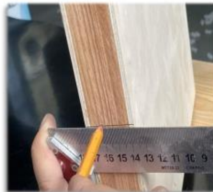
Trazo en el canto de la puerta.