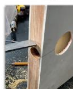
Embutido de Picaporte.