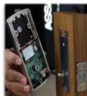
Conectamos amés exterior con el interior.