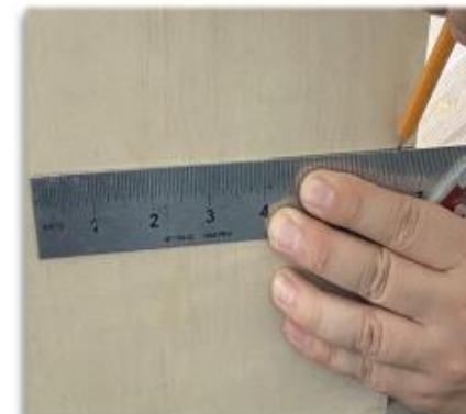
Trazo en la hoja de la puerta.