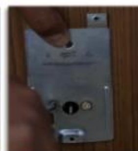
Sujetamos teclado exterior.