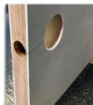
Perforamos en el Canto de la Puerta ( broca sierra 1").