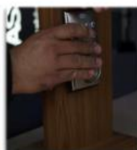
Instalamos teclado exterior.