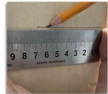
Marcamos 60 mm en la hoja de la puerta.