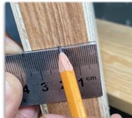
Punto medio del canto de la puerta.