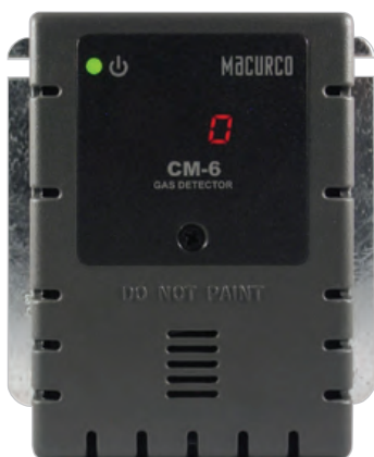
Carcasa gris (estándar)