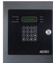
Paneles de Control