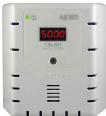
Opción de carcasa blanca

Los detectores de gas fijos Macurco Serie 6 y 12 brindan soluciones que salvan vidas y ayudan proteger a las personas y las propiedades. Estos detectores de gas fijos están diseñados para la detección, mitigación y notificación de niveles bajos. Deje que estos detectores hagan el trabajo por usted cerrando válvulas, encendiendo ventiladores, activando bocinas y luces estroboscópicas, y notificando a los paneles de incendios y sistemas de automatización de edificios cuando los gases alcanzan límites clave.