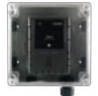
Kit de carcasa resistente a la intemperie (El detector se vende por separado)