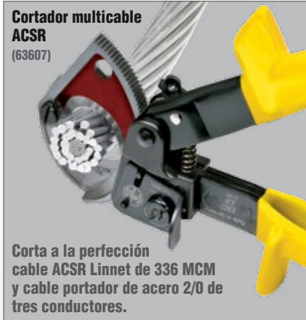
Cortador multicable ACSR (63607)

Corta a la perfección cable ACSR Linnet de 336 MCM y cable portador de acero 2/0 de tres conductores.