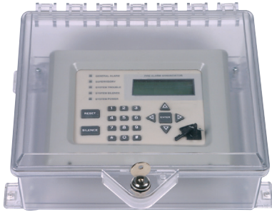
STI-7520 con Cerradura con Llave