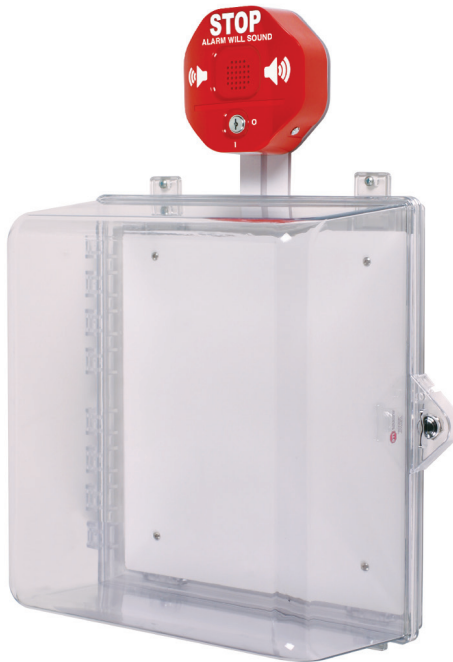
STI-7533 con Cerradura con perilla de accionamiento manual