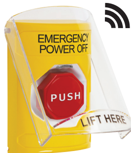
Escudo Stopper® Station Shield (Para tapar 2, A)

Proteger su estación STI Stopper Station de daños o el intemperie y para ayudar a detener la activación accidental o maliciosa.