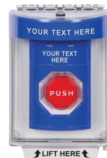
Universal Stopper® (Para tapar 3, 4, 7, 8)

No se pueden colocar etiquetas en la tapa para la Stopper Station.