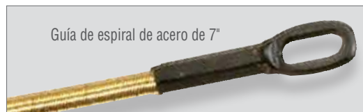
Guía de espiral de acero de 7"