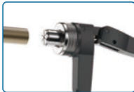
Abrir la palanca a 90° e insertar el tubo