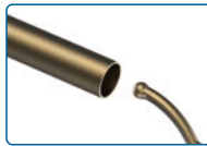
Desbarbar el tubo