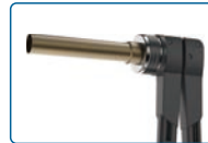
Completar la expansión