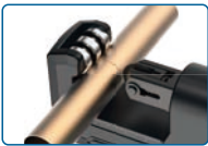
Cortar el tubo