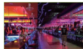
Centros de Ocio